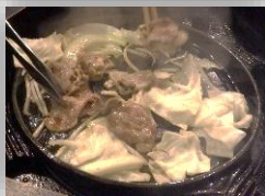
連日連夜、食べっぱなしの 飲みっぱなし。