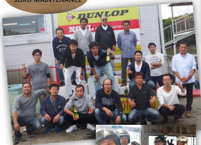
札幌到着早々のお楽しみ は新千歳モーターランドでの カートレース大会。昔の血が 騒ぐ人続出！