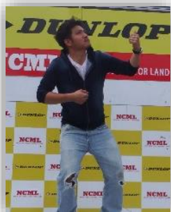
◀ 今回の幹事さん。計画から 実施まできめ細やかな配慮は 幹事さんだからできたことです。