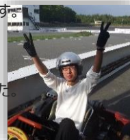
▶ 幹事をサポートしてくれました ありがとうございました♪